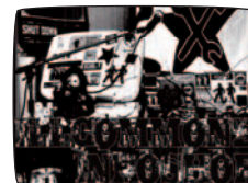
イルコモンズ・インフォショップ(仮称) 建設準備室企画「イルコモンズ回顧と展望展(仮称)心斎橋展示室」 [ilcomonz infoshop] イルコモンズ 2008 / 会期中公開制作

ヨハン・グリモンブレ+シャルロット・レウノ 2007 / モニター2台のインスタレーション ヨハンとシャルロットのキュレーションによる作品。