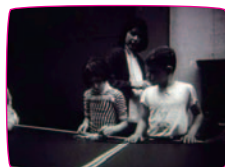
子どもたちが映像をつくる [Children Make Movies] ディーディー・ハレック 1961 / 9min