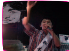
素人の乱 [amateur riot] 中村友紀 2007 / 90min

Leila Khaled commandeers TWA Boeing 707 into 7-min detour over occupied homeland, August 1969