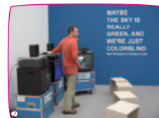
たぶん空の本当の色は緑で、わたしたちが色を判別できないだけなのかも知れない [Maybe the sky is really green, and we're just colorblind]

[remoscope workshop]とは、remo (NPO 法人 記録と表現とメディアのための組織) が主宰する映像メディアワークショップ。6つのルールに則り、撮影メソッドのようにそれぞれ持ち寄り鑑賞会を行います。これまで小学生からシニアまで多くの若々が参加しましたが、今回は2007年12月に開催されたワークショップ参加者の作品を中心に上映。