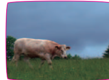
remoscope 選集 remoscope workshop 参加者による作品 2004~2007 / total 20min

[remoscope workshop]とは、remo (NPO 法人 記録と表現とメディアのための組織) が主宰する映像メディアワークショップ。6つのルールに則り、撮影メソッドのようにそれぞれ持ち寄り鑑賞会を行います。これまで小学生からシニアまで多くの若々が参加しましたが、今回は2007年12月に開催されたワークショップ参加者の作品を中心に上映。