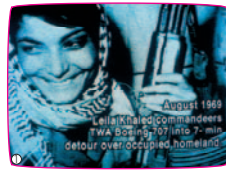
ダイヤルヒ・ス・ト・リ・ー [Dial H-I-S-T-O-R-Y] ヨハン・グリモンブレ 1997 / 68min / カラー & 白黒

上映作品介绍(一部) ●は、上映会方式での鑑賞。▲は、テレビモニターで随時鑑賞可能。■は、インスタレーション作品です。