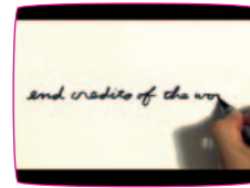
エンド・クレジット・オブ・ザ・ワールド [end credits of the world] 岩瀬拓郎 2007 / 10min30sec