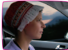
サーミ・ニエイダ・ヨイク [Sami nieida jojk] リセロツテ・ワイスト 2007 / 58min33sec