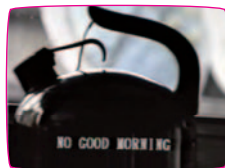
ソングス・ウィズアウト・ワーズ [songs without words] 谷川俊太郎 1982 / 17min