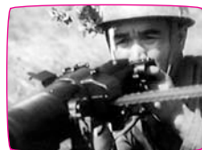
戦ふ兵隊 亀井文夫 1939 / 66min / 白黒